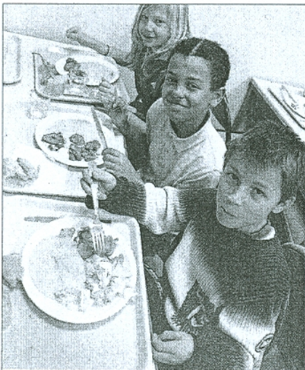
« S'il vous plaît, on veut plus de desserts »

les collèges privés du Rhône (28,9 % en incluant le public). Il faut dire que les tarifs vont de pair : environ 100 euros par mois sur le plateau croix-roussien. A Givors, pour citer un autre exemple, cette inscription n'excède pas 41 euros si les revenus de la famille sont modestes. Les effectifs de ce collège comprennent plus de la moitié d'élèves défavorisés, ce qui nécessite, pour le chef d'établissement, et à l'instar de ses collègues du public, un travail sur l'image auprès des familles.