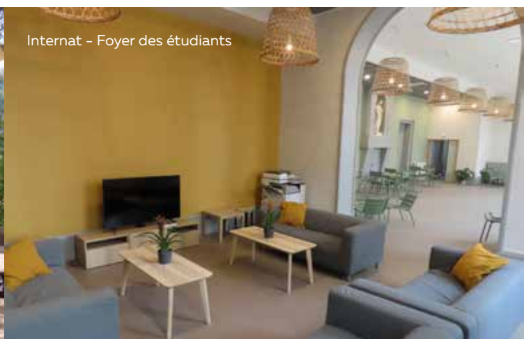
Internat - Foyer des étudiants